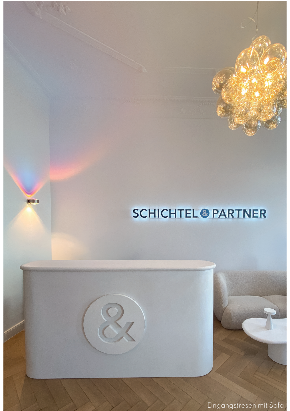
Eingangstresen mit Sofa